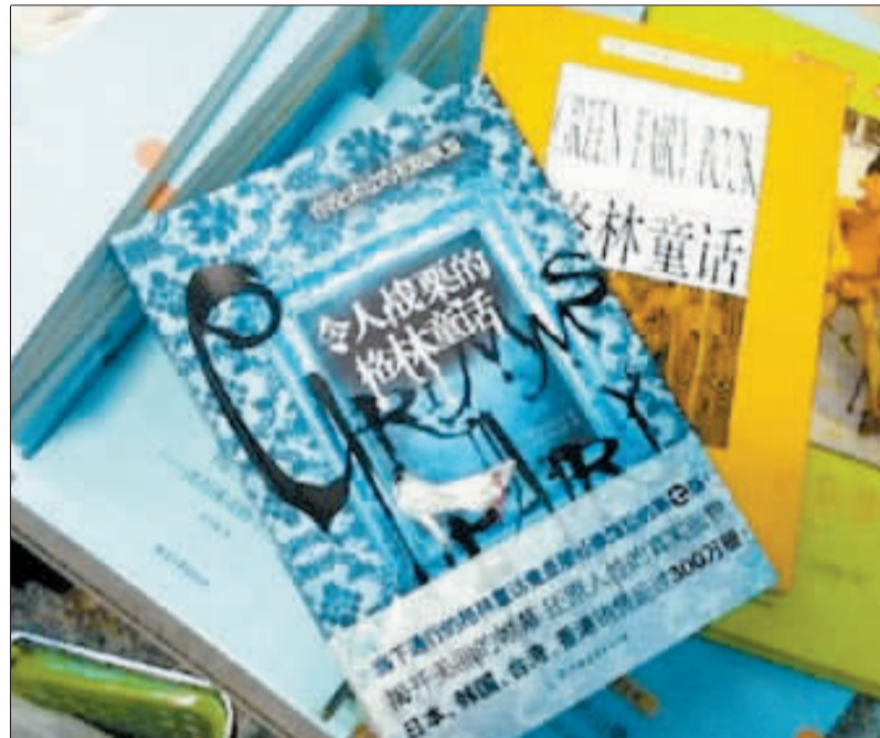
日前被勒令下架的“童书”——《令人战栗的格林童话》,网友戏称“很黄很暴力”。

在北京举行的首届“读友杯”少儿类型文学大赛暨《读友》创刊三周年座谈会上,中国儿童文学界的专家指出,面对商业诱惑,一些作家过度迎合市场,制造带有暴力、色情内容的儿童文学作品,侵蚀孩子们的心灵,值得高度警惕。