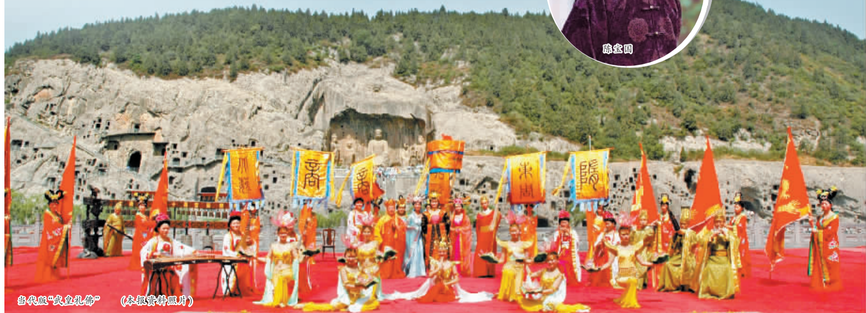
当代版“武皇礼佛”