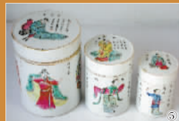
↓清代道光粉彩“无双谱”盖盒一套