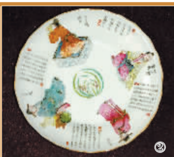
清代道光粉彩“无双谱”折腰盘