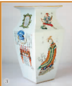
清代道光“无双谱”粉彩方瓶