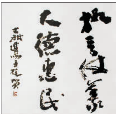
执言仗义 大德惠民(书法) 李进学