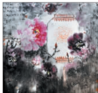
夜赏牡丹图(国画) 寇兴耀

洛阳日报报业集团是一个干事创业的团队，每位报人都在不同的领域充实奋进，努力为读者烹饪出可口的精神食粮。