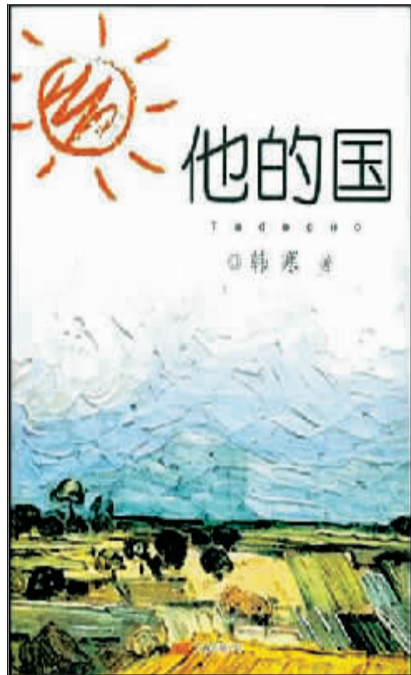
韩寒小说《他的国》封面