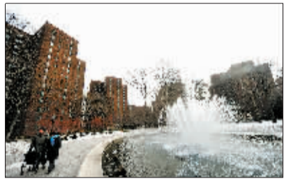
两位老人走在曼哈顿斯泰弗森特社区内。