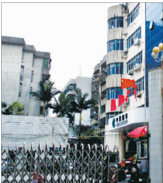
广东省汕尾市烟草专卖局大门。