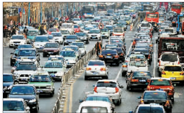
花园路是郑州市堵车最严重的道路之一。