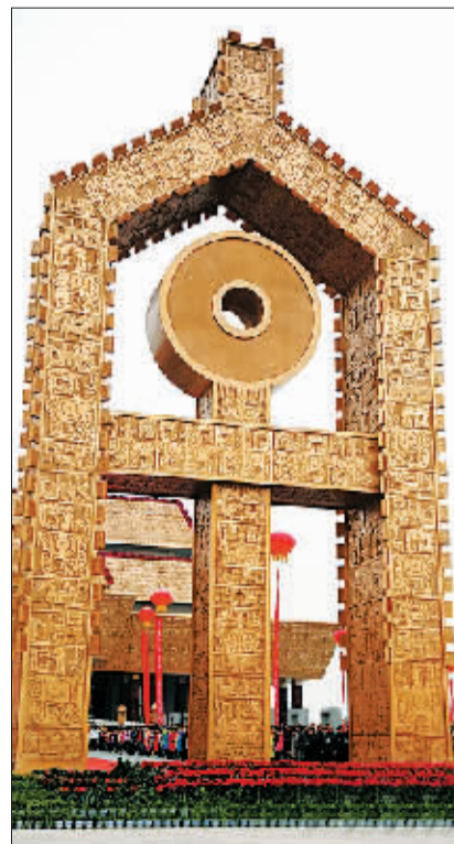
坐落在中国文字博物馆广场上高 18.8 米的“字坊”,整体造型采用了甲骨文“字”的写法。(资料照片)