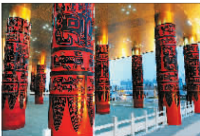
在中国文字博物馆外廊的雕柱上,红黑相间的饕餮纹图案构成了殷商宫殿建筑形象的基本要素。(资料照片)

洛阳→中国文字博物馆自驾路线 洛阳→二广高速→长济高速→京港澳高速→安阳/S301→京港澳高速出口→301 省道→人民大道