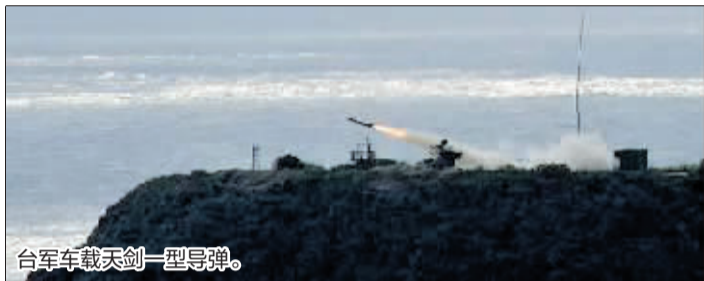
台军车载天剑一型导弹。

台军“联合防空火力实弹射击测考”18日上午于屏东九鹏基地开场,为近年最大规模的公开导弹演习,其中数枚导弹目视未命中目标。军方说,共6枚导弹测考失效,初步研判是过靶未爆、飞行轨迹异常等原因,各式导弹的命中率约在70%到90%。