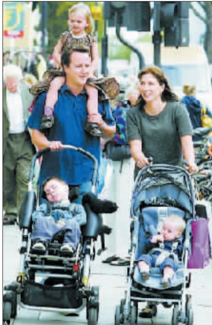
英国首相卡梅伦一家。

女人，把男人都边缘化了。人们都觉得，母亲就应该呆在家里，而父亲就是要赚钱养家。这是爱德华七世时代(1841年至1910年)的观念。这样一来，女人、小孩、男人都在受苦，母亲大部分时间都在照顾小孩，如果没带小孩，就要被人指指点点；老是在带小孩，工作方面就面临巨大阻碍，而小孩和父亲互相思念与对方在一起的时光。旧观念不再适合21世纪的英国。”