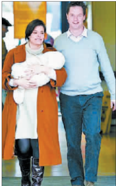
克莱格夫妇与新生儿。