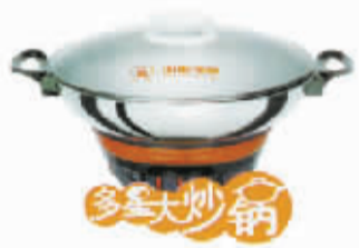
专卖店品尝多星锅做出的美食吧! 电话:65359913 18739091363