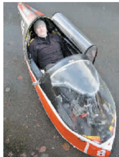
本版图文整理 杨玉梅

据伊恩称，驾驶躺车就像是在做移动桑拿，一段时间后身体就会出汗。有时候自己穿着短袖在零下20度的气温中“开车”也不会感觉到冷。(凤凰网)