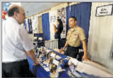
在加州一个大型招聘会上,应聘者寻找工作机会。