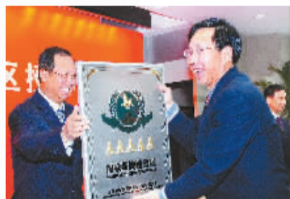
中共嵩县县委书记马振宇(右)从国家旅游局党组副书记、副局长王志发手中接过 AAAAA 级旅游景区金字招牌。