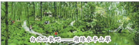
白云山氧吧——湖绿水半山翠