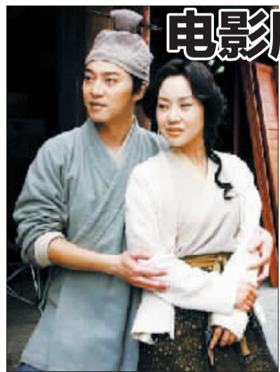
电影版《武林外传》剧照

晚会时长约两个小时,表演队伍近300人。据悉,洛阳市春晚已成为全市观众喜闻乐见的传统文化盛宴,至今已连续举办21年。