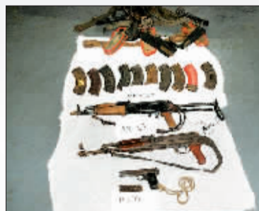
马来西亚海军在亚丁湾海域缴获的索马里海盗的武器。