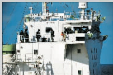
21日,韩国救援人员控制被索马里海盗劫持的货船。