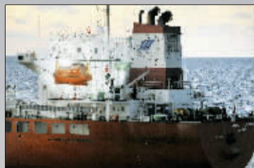
21日,韩国海军士兵登上被索马里海盗劫持的货船。

“三湖珠宝”号属于韩国三湖海运公司。三湖公司另一艘船“三湖梦想”号油轮去年遭海盗劫持7个月获释。海盗声称,他们通过这艘油轮获得创纪录的950万美元赎金。