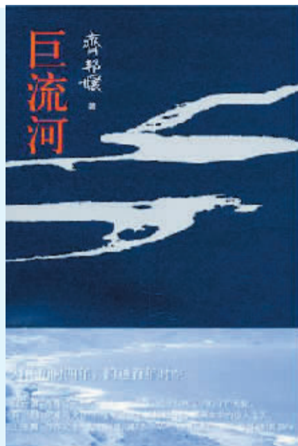
书名:巨流河 作者:齐邦媛 出版社:生活·读书·新知三联书店

我们出山海关到北平,转津浦铁路,火车走了三天两夜,到达南京下关车站。我看到英俊而陌生的父亲站在月台上,等着迎接他聚少离多的妻儿。