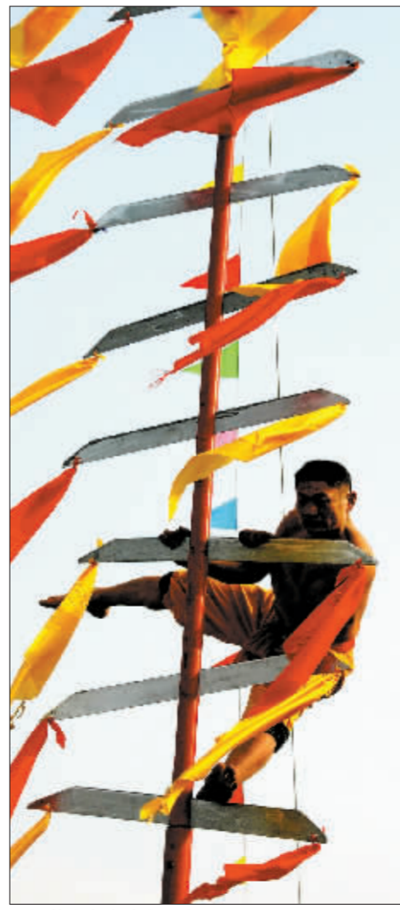
民间艺人在表演上刀山。