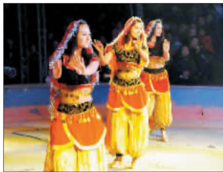
具有异国风情的舞蹈。

□记者 张贵坊 曾宪平 潘郁 张晓理 社武 赵朝军 见习记者 谢磊 高亚恒 马毓军 许晓洁 马菁华 文/图