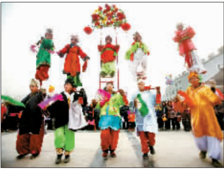
具有民俗特点的表演。

一名姑娘不停抖动短鞭,催促马儿跑得快些、再快些,只见她上翻、下钻、转身、旋转,漂亮地完成了一连串高难度动作,带着微笑离开了舞台。