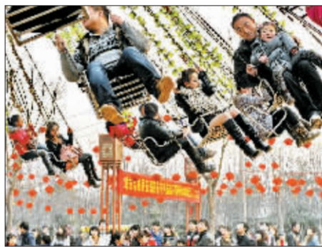
逛庙会的市民在游乐场玩耍。