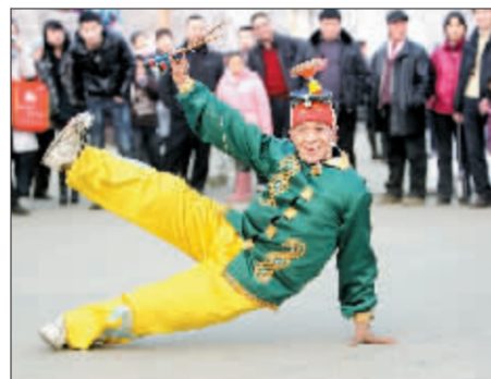
民间艺人在表演空竹。