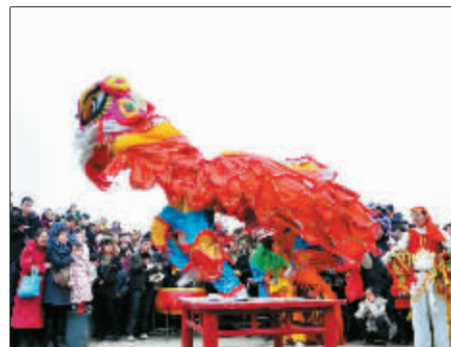
舞狮表演吸引了众多观众。