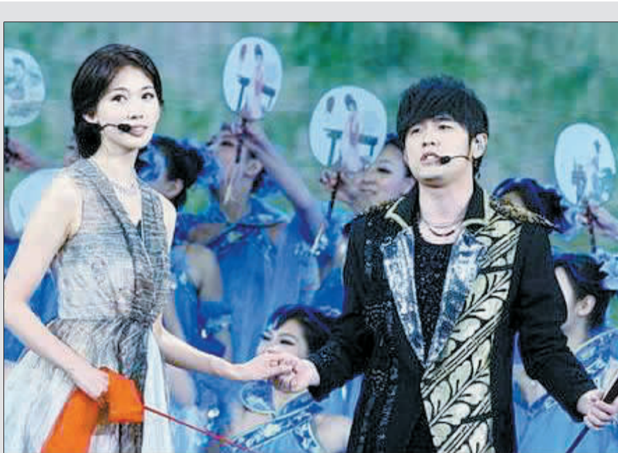
林志玲和周杰伦演唱《兰亭序》。

虽说众口难调,但也不带这样忽悠观众的吧!“旭日阳刚”的紧张、萧敬腾的破音被赞真实,“笑帝”和美女观众夏达被捧得比节目本身还红,这些似乎都在证明兔年春晚根本就是来“打酱油”的。