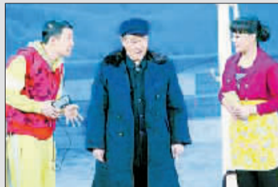
赵本山小品《同桌的你》