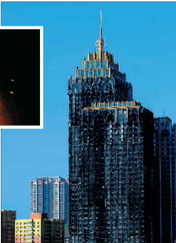
▶火灾发生后的皇朝万鑫国际大厦。