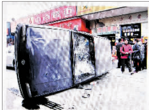
这是网上有关该事件的图片。

新华社武汉2月10日专电从2月9日起，一条消息在网络上引起了网民的极大关注：2月8日下午，在武汉市青山区建设二路上，一辆奔驰越野车狂追数百米撞击一辆桑塔纳轿车，桑塔纳车主被撞至人行道后弃车跳窗逃命，奔驰