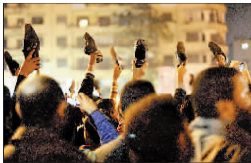
穆巴拉克发表讲话前,示威者举起鞋表示不满。

新华社北京2月11日电 埃及副总统苏莱曼11日通过国家电视台宣布,穆巴拉克已经辞去总统职务,并将权力移交给军方。