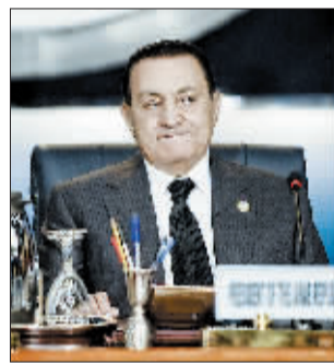
穆巴拉克 (资料图片)