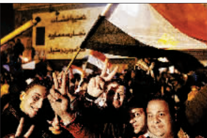
11日，民众在埃及首都开罗市中心的解放广场庆祝穆巴拉克辞职。