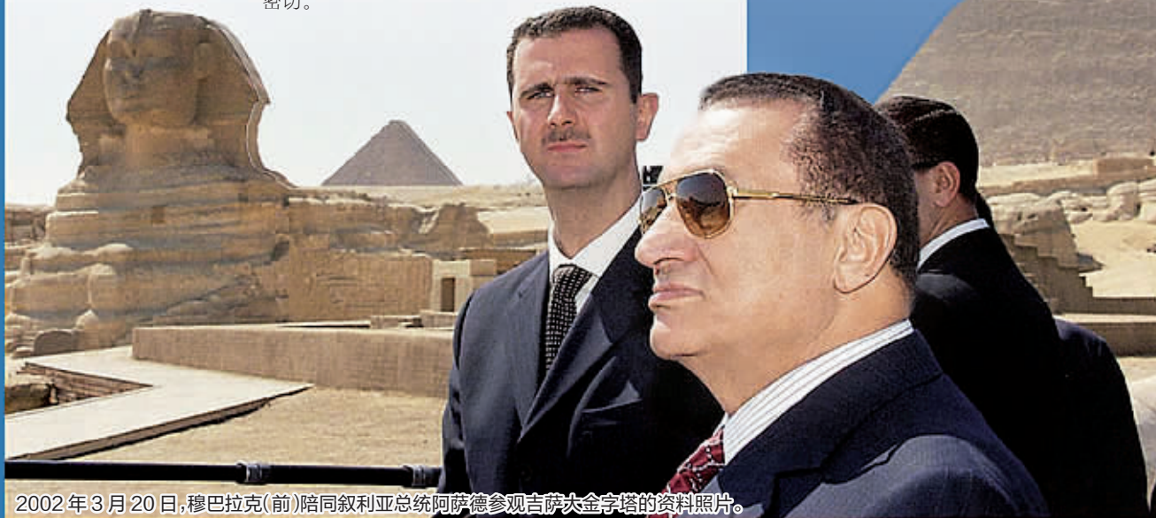
2002年3月20日，穆巴拉克(前)陪同叙利亚总统阿萨德参观吉萨大金字塔的资料照片。

检方还禁止钢铁大亨、执政党民族民主党组织书记艾哈迈德·伊兹离境。