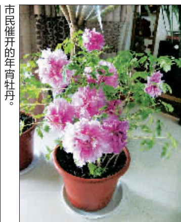
市民催开的元宵牡丹。

神州牡丹园负责人表示,此次活动中,市民们对牡丹催花表现出极大的关注和参与热情,并在催花过程中形成互动,收到了良好的效果。被评为“催花能手”的市民,可在本周日前到神州牡丹园催花基地领取两盆优质催花牡丹作为奖励。