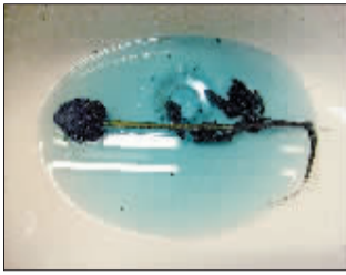
3.浸泡蓝玫瑰的水变色了。