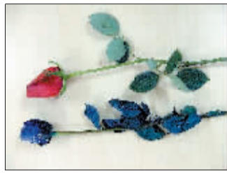
1.一枝红玫瑰和一枝蓝玫瑰。