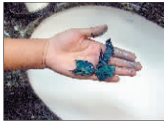
4.搓揉蓝玫瑰，手指被染色。