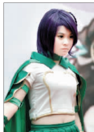
比赛现场。网友 铁树 sunsea007 摄