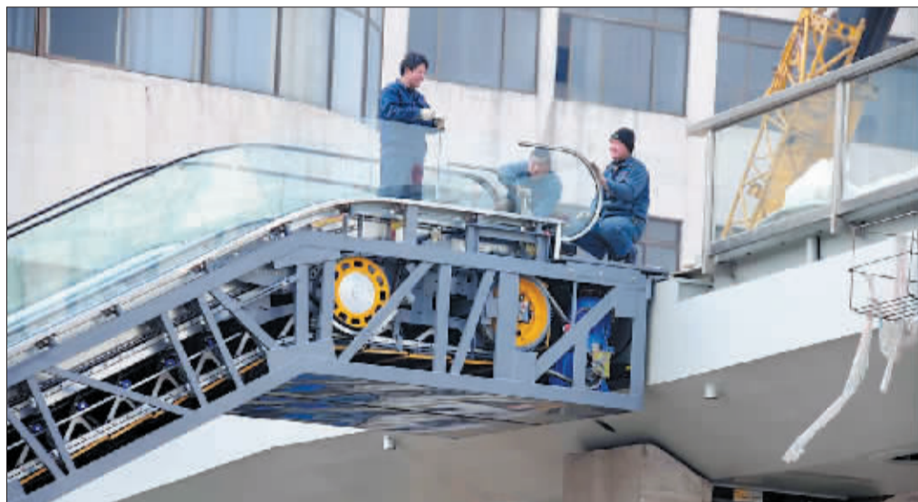
在景华路过街天桥上,工人们正在安装自动扶梯。

景华路河科大一附院门前过街天桥全长47.9米,桥面宽4米,呈现和老城集市街口天桥一样的设计风格:简约、美观、时尚。桥面南端与河科大一附院住院楼连接,方便市民就医。此外,它还多了一项人性化设施——老弱病残人士专用的无障碍垂直升降梯,垂直升降梯将被安装在天桥的南北两侧,通过前室(通往桥面的通道)与桥面相连。目前两侧的