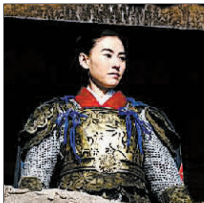
张柏芝复出后接的第一部戏就是《杨门女将》。