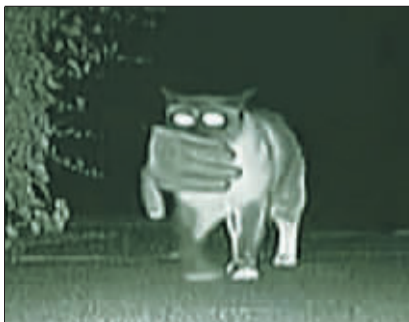
监控录像中的“大盗”。

中国日报供本报特稿 据英国媒体当地时间2月16日报道,从3年前开始,美国加州圣马特奥小镇(San Mateo)的居民发现家里总是莫名其妙地丢失物品,他们甚至担心盗贼盯上了自己。直到电视节目《动物星球》近日在小镇装上监控录像后,居民才惊奇地发现,盗贼竟然是当地的一只猫咪“灰灰”。一般情况下,这只黑白相间的猫咪作案都会选择在晚间,并且每次盗窃的时间不会