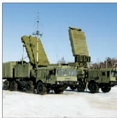
俄新型S-400防空导弹系统。

日本防卫大臣北泽俊美15日说:“日本打算跟踪俄罗斯在北方四岛的军事存在,俄罗斯有加强(在北方四岛)军事活动的趋势,我们需要密切关注。”