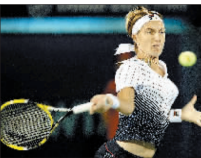
2月19日,俄罗斯选手库兹涅佐娃在比赛中回球。当日,在阿联酋举行的WTA巡回赛迪拜站半决赛中,俄罗斯选手库兹涅佐娃以2:0战胜意大利选手彭内塔,晋级决赛。