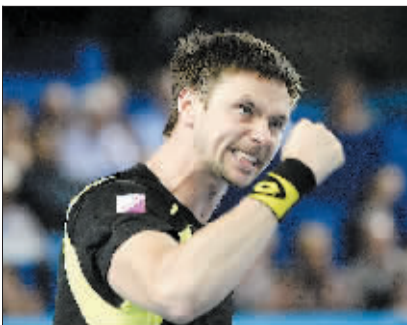
2月19日,瑞典选手索德林庆祝获胜。当日,在法国南部城市马赛进行的ATP13网公开赛半决赛中,索德林以2:0战胜俄罗斯选手图萨诺夫,挺进决赛。