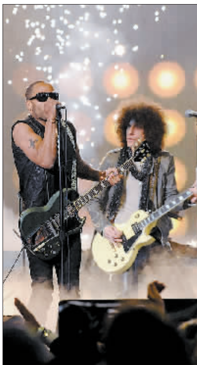
歌手克罗维兹(左)献唱，助阵全明星。

目前，13 次参加全明星赛的科比已累计命中 244 分，在全明星赛历史得分榜上排名升至第四，而 7 次参加全明星赛的詹姆斯则以每届比赛平均收获 24.4 分，成为全明星赛历史上场均得分第一高手。