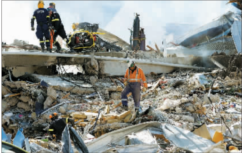
2月24日,在新西兰南岛克赖斯特彻奇,救援人员在废墟中搜寻幸存者。

据新华社新西兰克赖斯特彻奇2月25日电 中国驻新西兰大使馆震灾应对临时工作组负责人25日说,目前有26名中国留学生在克赖斯特彻奇地震中失踪。临时工作组负责人、使馆教育参赞王胜刚对新华社记者说,使馆通过多方渠道汇集的信息获悉,地震中失去联络的中国留学生达26人,无法得知他们的具体情况。失踪者主要是克赖斯特彻奇国王教育学院的学生,且绝大多数是女生。由于该校设在已因地震而严重垮塌的坎特伯雷电视