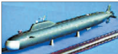
“亚森”级核潜艇模型

未来,批量装备的“亚森”级核潜艇将逐步替换“奥斯卡”-2型巡航导弹核潜艇,成为俄海军新一代水下攻击利器。另据西方情报机构分析,在艇艏球形声呐的配合下,新