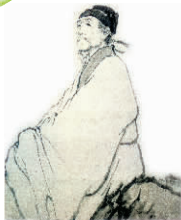
杜甫理性自重因是天蝎座?