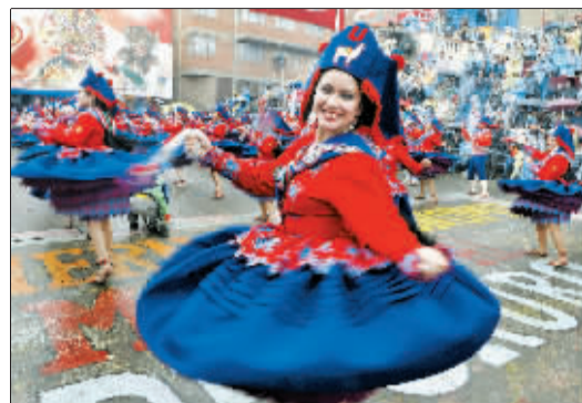
5日,舞蹈演员在玻利维亚奥鲁罗狂欢节上表演。