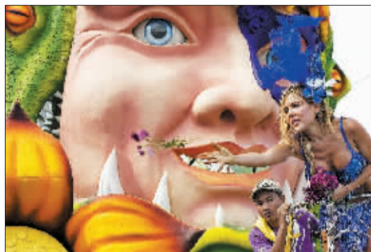
5日,在哥伦比亚巴兰基亚,一名模特向观众抛撒鲜花。