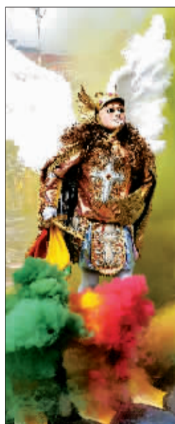
5日,舞蹈演员在玻利维亚奥鲁罗狂欢节上表演。