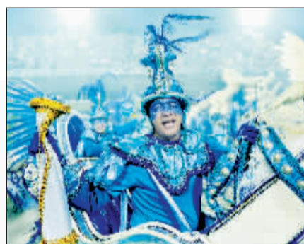
▲▼ 5日,在巴西里约热内卢,参加桑巴巡游的演员冒雨在桑巴大道上表演。