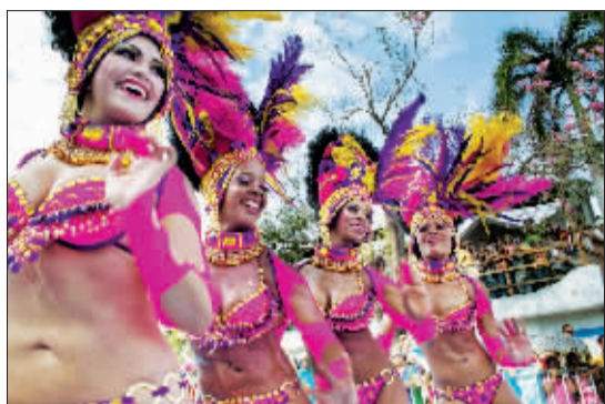
5日,在哥伦比亚巴兰基亚,人们在狂欢节上表演。