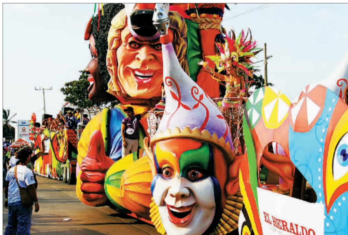
5日,一辆巨型彩车行驶在哥伦比亚巴兰基亚狂欢节游行队伍中。