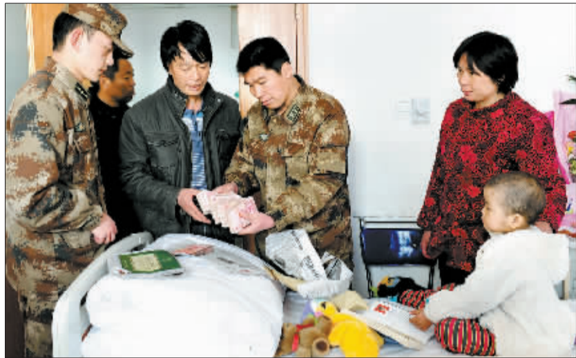
“解放军叔叔”给娇娇送来“爱心款”。