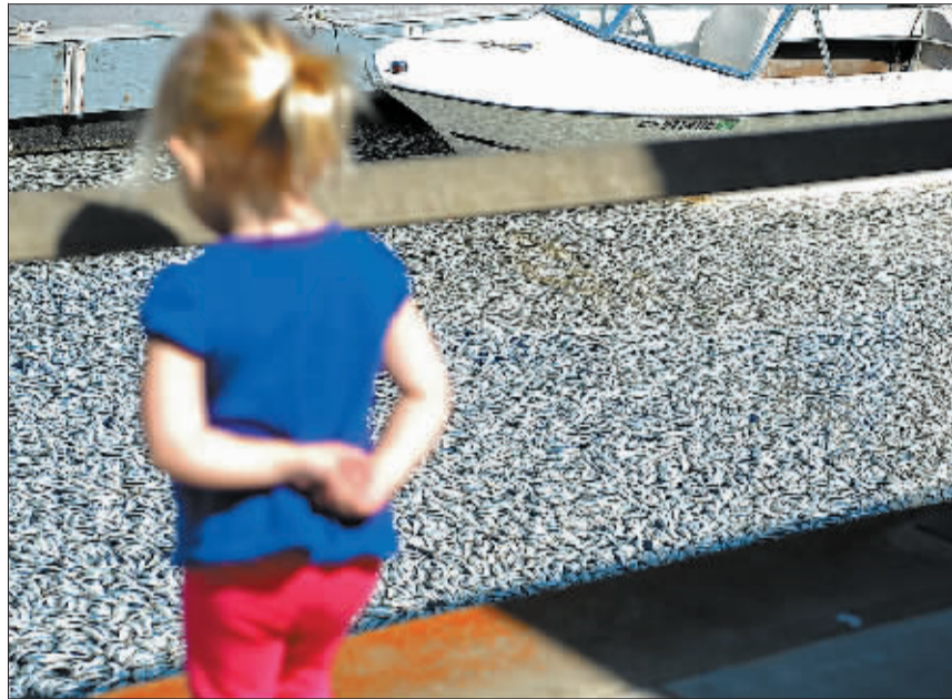
加州洛杉矶附近的国王港口出现数百万条死鱼。