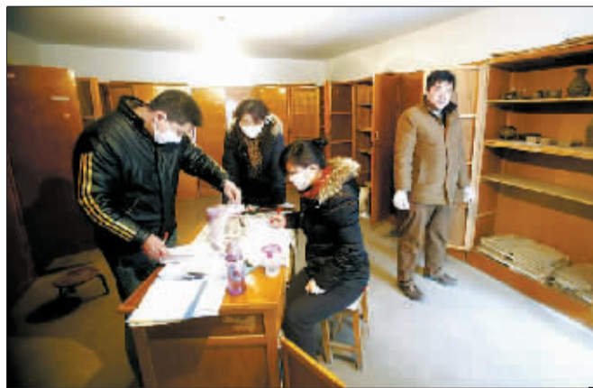
◀文物仓库内, 文物工作人员昼夜忙碌。