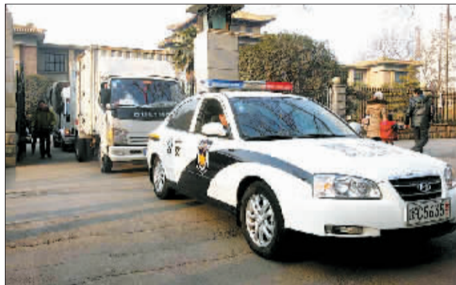
◀文物“搬家”, 公安人员武装押运。