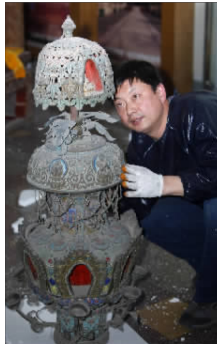
▲小心翼翼地从小玻璃展柜内取出文物。