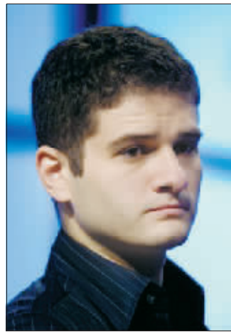
达斯汀·莫斯科维茨