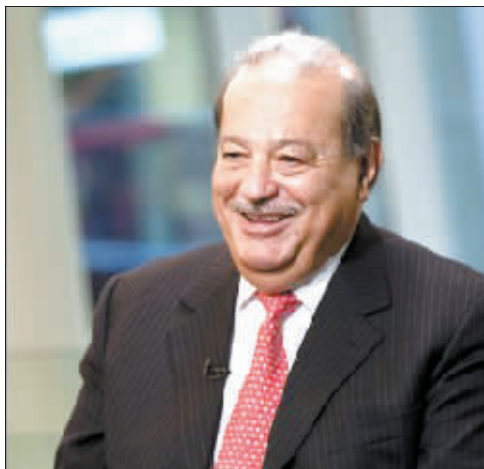
卡洛斯·斯利姆·埃卢

《福布斯》杂志首席执行官兼总编辑史蒂夫·福布斯在当天召开的记者招待会上说,今年上榜的富豪人数从去年的1011人增至1210人,为该杂志富豪榜编制以来人数最多的一次。与此同时,上榜富豪的资产总额达到创纪录的4.5万亿美元;人均财富达37亿美元,比去年增加2亿美元。而中国大陆上榜人数首次过百,达到115人,富翁人数仅次于美国。