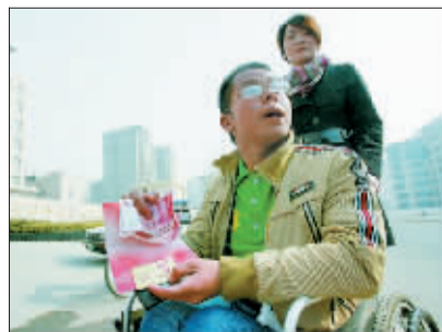
小王拿到了公交公司的赠卡。