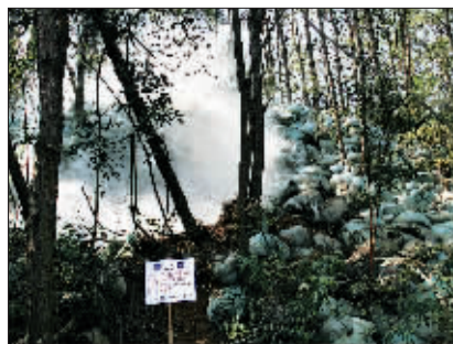
浓烟从被炸毁的地下工厂废墟里升起。