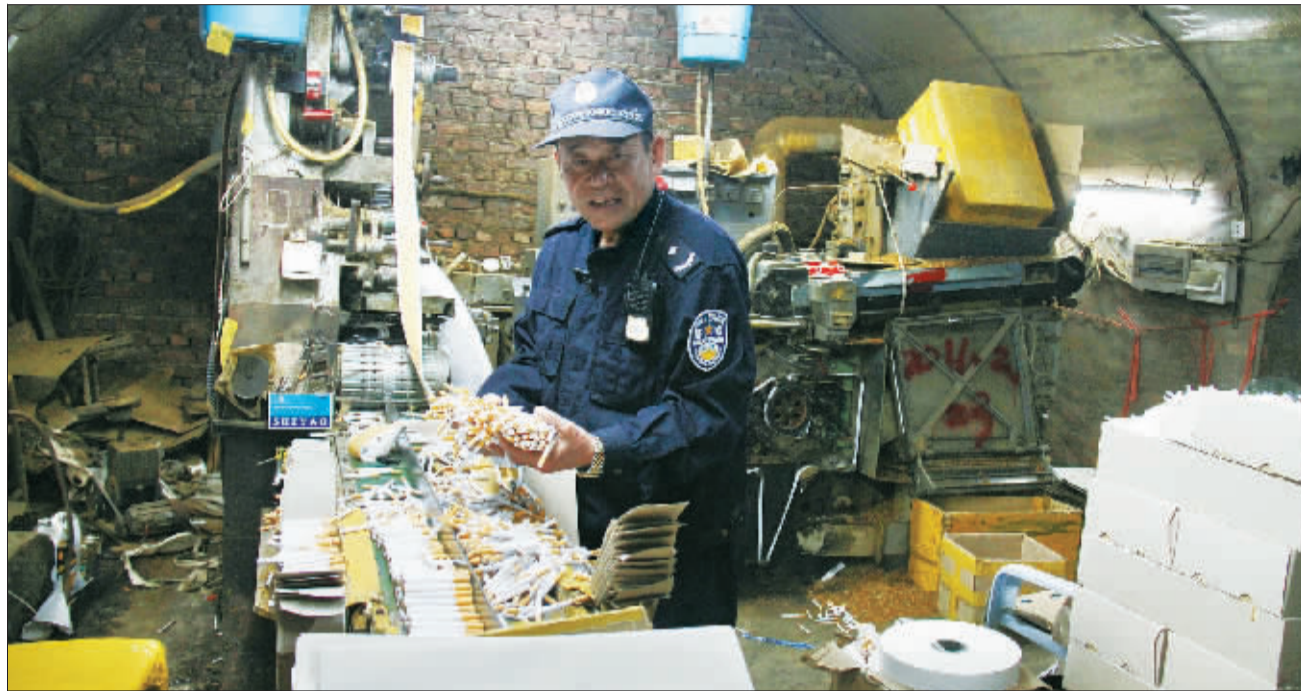
打假队员在地下工厂查获的卷烟机。