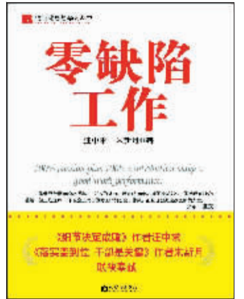
○汪中求 朱新月 著

通用电气公司前任总裁杰克·韦尔奇认为：“没有什么细节会因其细小而不值得你去挥汗，也没有什么大事大到尽了力还不能办到。”这句话成了管理名言。 在工作中，我们虽然不可能注意到所有细节，但我们能做的就是以零缺陷的目标来要求每一个进入工作流程的环节。这就需要我们先对工作的各个环节了如指掌，很多失误都是因为对工作流程一知半解。 如果疏忽了细节，就有可能导致不幸，甚至是灭顶之灾。日本东芝笔记本的小问题使得它不得不在美国赔偿给客户10亿美元；美国福特公司由于“凡世通”轮胎问题导致巨额亏损；几年前在中国名噪一时的“三株”口服液也是因为忽视媒体报道的负面影响而招致覆灭。 天下大事，必从小处做起。在小事上都敷衍、拖延、马马虎虎、对付迁就、粗粗糙糙的人，难以成为人格伟大的人。 正是要求明确和严格，以及员工的坚守，国际名牌POLO皮包凭着“一英寸之间一定缝满八针”的细致规格，20多年立于不败之地。 一般情况下，给员工留下印象最深的、终生难忘的往往是那些不起眼的小事。难怪日本“经营之神”松下幸之助会说：“大事小事由我处理，不大不小的可以安排别人去做。” 我们中华民族是一个优秀的集体，但在精细意识方面，与其他一些民族相比显得不足，忽视细节和缺乏理性、科学、精确、严肃的文化素质和文化的普通自觉以及与此相适应的制度设施与管理