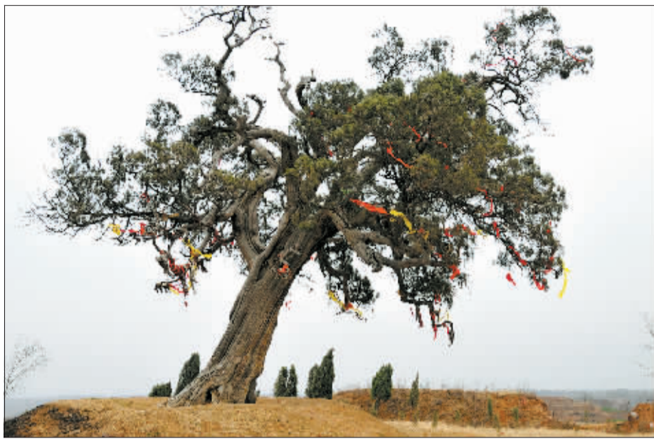
迎风舞动的红布条上,牵着当地人对“孤柏奶奶”的深深敬意。