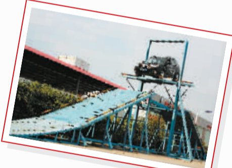
斯巴鲁汽车特技表演

体验战略的重要举措。该车长18米,宽5米,内设德国西门子音响系统、LCD影像播放器、荷兰飞利浦照明系统。同时,该4S店还在展区设有车辆展示区、客户休闲区及品牌文化墙,让消费者从产品、服务、品牌理念等多个角度,体验东风雪铁龙“人性科技 创享生活”的品牌理念和“随心操控”的产品价值。