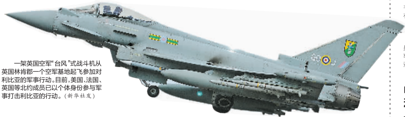
一架英国空军“台风”式战斗机从英国林肯郡一个空军基地起飞参加对利比亚的军事行动。目前,美国、法国、英国等北约成员已以个体身份参与军事打击利比亚的行动。

北大西洋公约组织成员国代表 20 日决定,北约不作为整体加入法国、美国、英国等国对利比亚的军事行动。