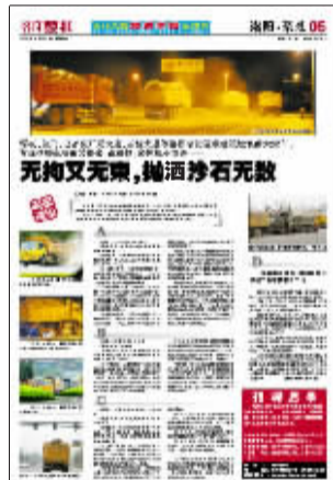
本报刊载相关报道的版面。

2010年5月13日本报A05版《无拘又无束,抛洒沙石无数》,报道了开元大道、王城大道等路段出现无遮盖货车沿路抛洒的情况。 2010年5月17日本报05版《洛栾快速通道也遭抛洒侵袭》,报道了洛栾快速通道伊川县平等乡路段出现散落石子带的情况。 2010年10月21日本报A09版《大货车沿路抛洒卷土重来》,报道了牡丹大道等路段出现大货车沿路抛洒的情况。 2010年11月9日本报A08版《开元大道脏了半边脸》,报道了运输车辆沿路抛洒的泥土将开元大道路面污染成红色的情况。 本月11日本报A12版《恼:沿路抛洒,卷“土”重来》,报道了市区多个路段可见满载建筑垃圾和土石方的无遮盖货车的情况。