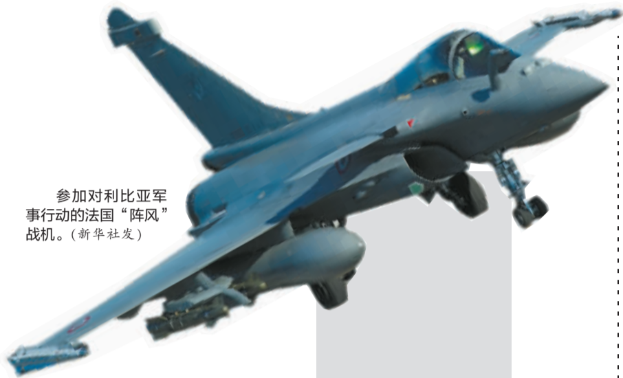
参加对利比亚军事行动的法国“阵风”战机。