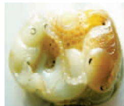
和田玉夹生在海拔3500米~5000米高的山岩中,玉质为半透明,抛光后呈蜡状光泽。其主要品种有羊脂白玉、白玉、青白玉、青玉、墨玉等。