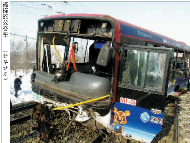
被撞的公交车