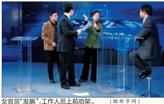
女官员“发飙”,工作人员上前劝架。(据新华网)

在当天的新闻发布会上,南昌市委外宣办负责人也表示,南昌市目前正在研究,将对有关人员作出相应行政处理。